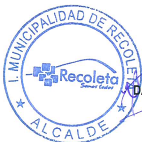
DANIEL JADUE JADUE ALCALDE